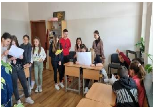
Творчески процес в УУС

https://ou-ranbosilek.webnode.page/za-ou-ran-bosilek/uchenicheskko-samoupravlenie/