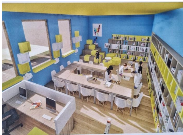
Проект на новата училищна библиотека